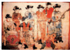
遼の国の河北宣化張世古墓に描かれた散楽図

〈泉鏡花の物語〉、そして〈超絶技巧のジャグリングパフォーマンス〉、これらが渾然一体となる新しい舞台『現代散楽』を是非お楽しみください。